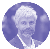
Laurent Wauquiez Président de la Région Auvergne-Rhône-Alpes