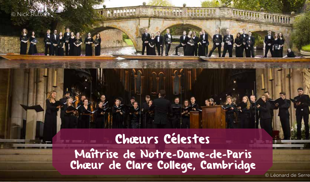
Chœurs Célestes Maîtrise de Notre-Dame-de-Paris Chœur de Clare College, Cambridge